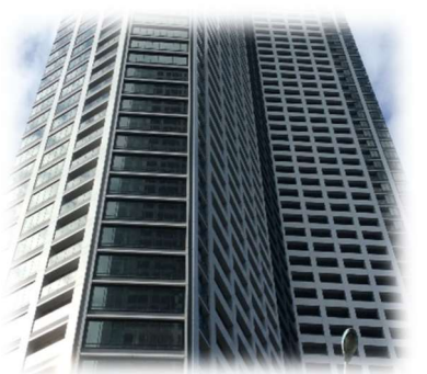
勝どきタワー・鹿島建設