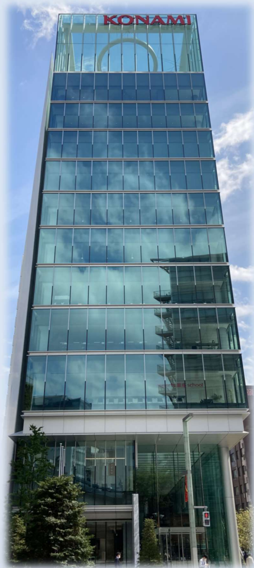
三井住友建設(株) 2020年度竣工 コナミクリエイティブセンター銀座