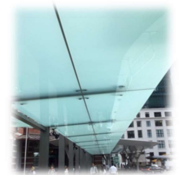
東京駅丸の内駅舎・歩道DPG 庇・鹿島建設