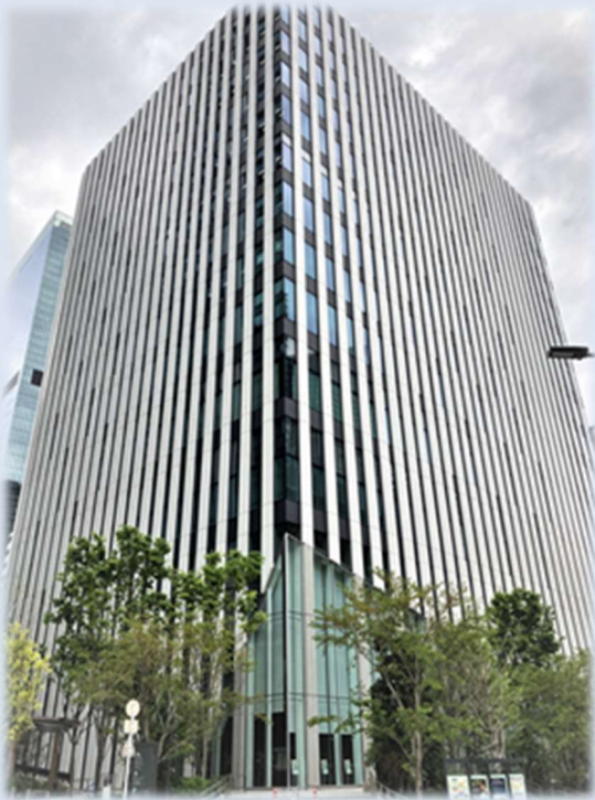
大成建設(株) 2020年度竣工 気象庁虎ノ門庁舎港区立教育センター