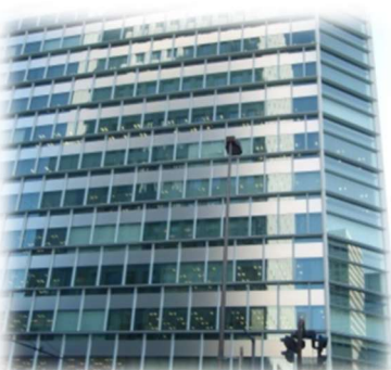
三井住友銀行呉服橋ビル・清水建設