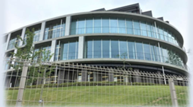
戸田建設(株) 2019年度竣工 日本文化大学2号館