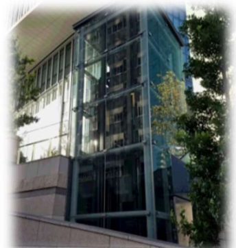
虎ノ門ヒルズ・MFG-EV-C・大林組