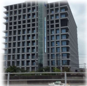
浦安市庁舎・鹿島建設