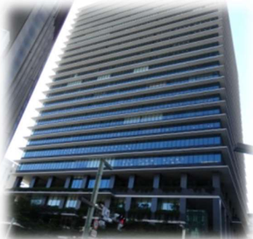
東京スクエアガーデン・大成建設