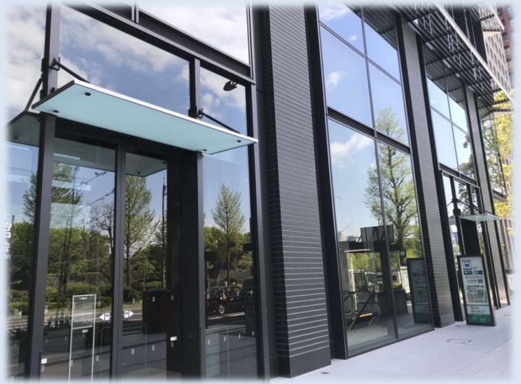
(株)大林組 2020年度竣工 みずほ丸の内タワー