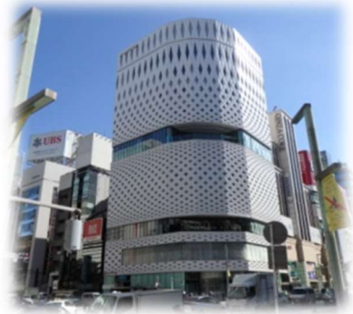
銀座プレイス・大成建設