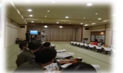
指宿・白水館にて