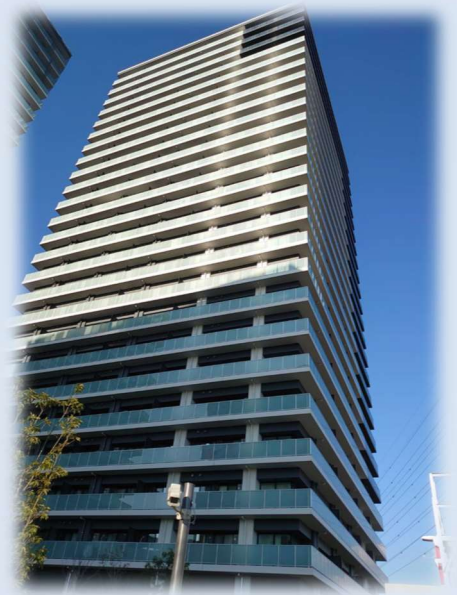
鹿島建設(株) 2020年度竣工 グレースアタワーズ海老名