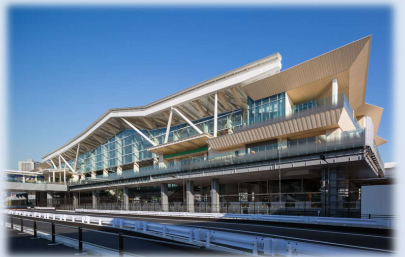
(株)大林組 2020年度竣工 高輪ゲートウェイ駅