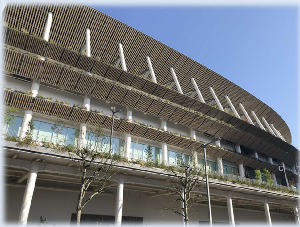
大成建設(株) 2019年度竣工 新国立競技場