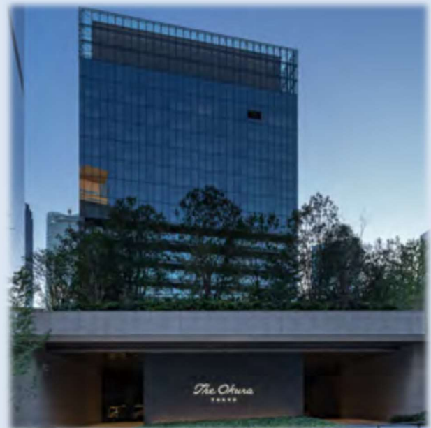
大成建設(株) 2019年度竣工 ホテルオークラ東京