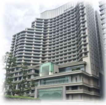
パレスホテル東京・大林組