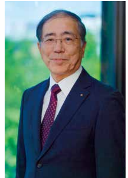
代表取締役社長執行役員